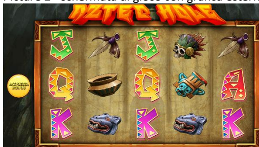
Descrizione: Grafiche di Aztec Hole