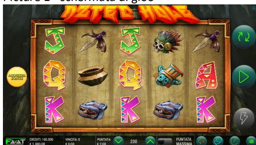
Descrizione: Grafiche di Aztec Hole