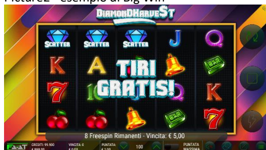
Descrizione: Grafiche di Diamond Harvest