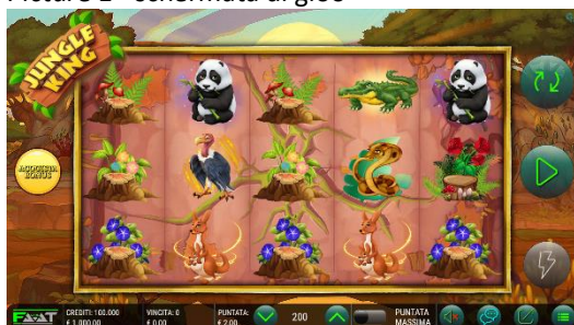
Descrizione: Grafiche di Jungle King