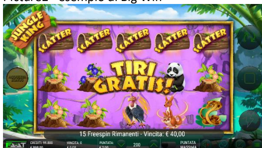
Descrizione: Grafiche di Jungle King