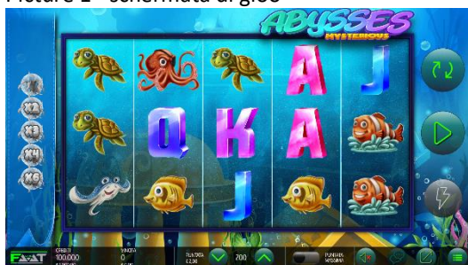
Descrizione: Grafiche di Mysterious Abysses