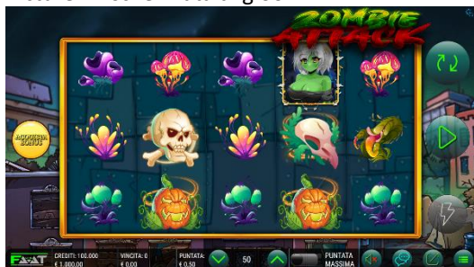
Descrizione: Grafiche di Zombie Attack